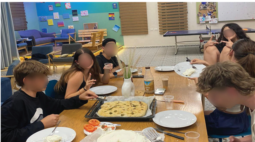
ארוחת חג במועדון - שכבת ח

במועדון הנוער התקיימה ארוחת חג חגיגית יחד עם החניכים- היה ערב נעים, מגבש ומלא אווירת חג, עם הרבה צחוק, מטעמים ותחושת יחד