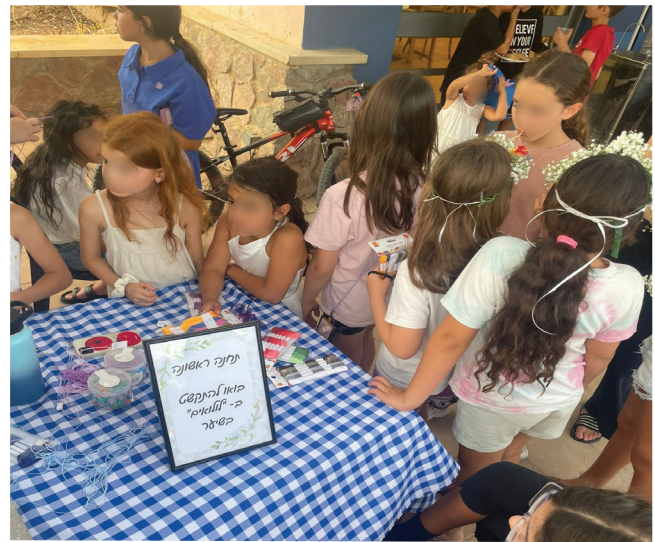
דוכני המחנות העולים