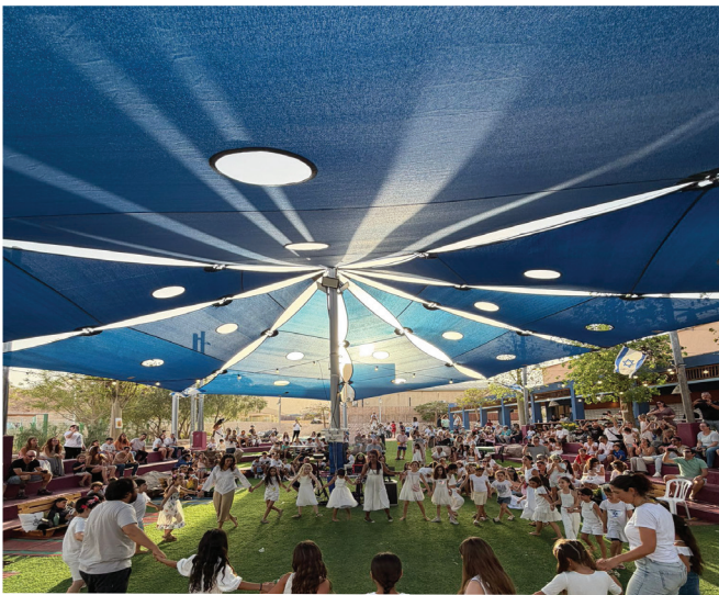
ריקוד שבועות שכבות א-ג

בשבוע שעבר חגגנו יחד כקהילה את חג השבועות, לכבוד החגיגות החינוך לקח חלק גדול בעשייה, התרגשות וברוח הקהילתית! ילדי שכבות א'-ג' התכוננו במרץ לריקוד השבועות החגיגי, לצלילי השיר האהוב "מוכר פרחים" של עופרה חזה. היה מרגש לראות את הילדים משקיעים, רוקדים ונהנים בדרך להופעה החגיגית תנועת המחנות העולים לקחה חלק משמעותי באירוע והקימה דוכני משחק והפעלה לילדים. תודה גדולה למדריכים ולמד"צים על ההשקעה, האנרגיה והעשייה מכל הלב