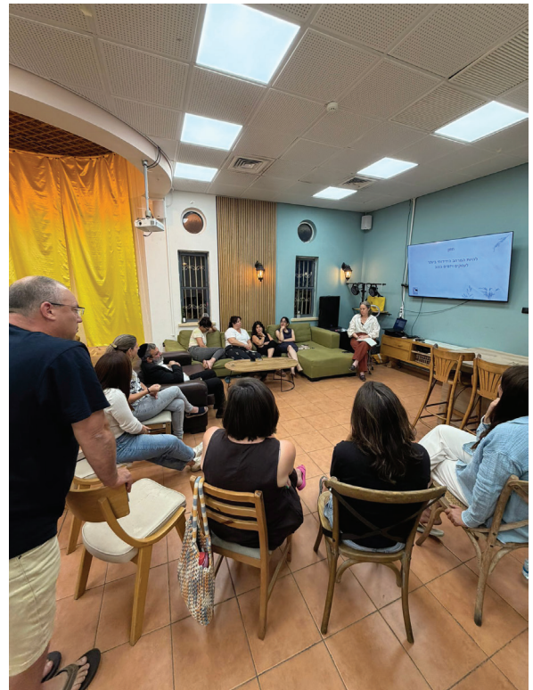
מפגש פורום תיירות ועסקים קטנים