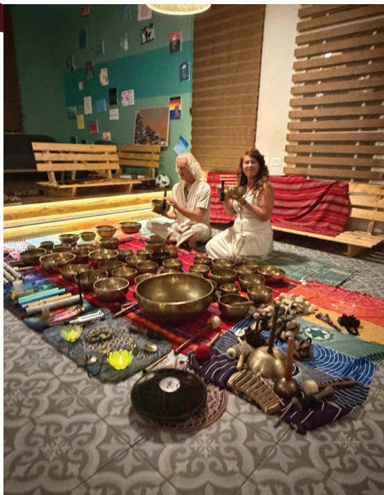
סדנת צלילים מרפאים